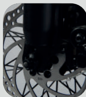
FREIO A DISCO