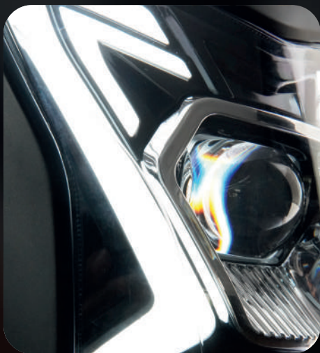
ILUMINAÇÃO FULL LED