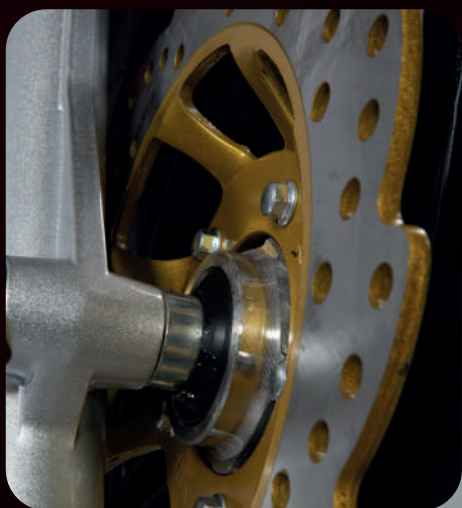
FREIO A DISCO