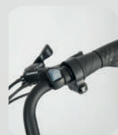
VEL. MÁX: 32KM/H