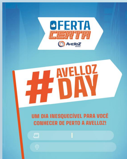
Convite Avelloz Day